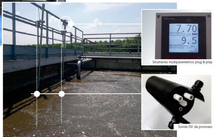
Strumento multiparametrico plug & play