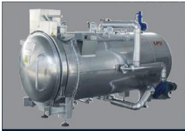
Autoclavi orizzontali Ø 1000